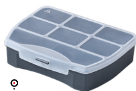
ORGANIZER DOMINO 12