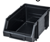
MODUŁBOX CZARNY 1.1