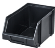
MODUŁBOX CZARNY 2.1