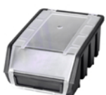
ERGOBOX CZARNY PLUS 2