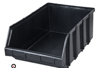
MODUŁBOX CZARNY 4.1