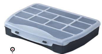
ORGANIZER DOMINO 25