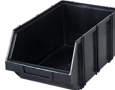
MODUŁBOX CZARNY 3.1