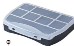
ORGANIZER DOMINO 19